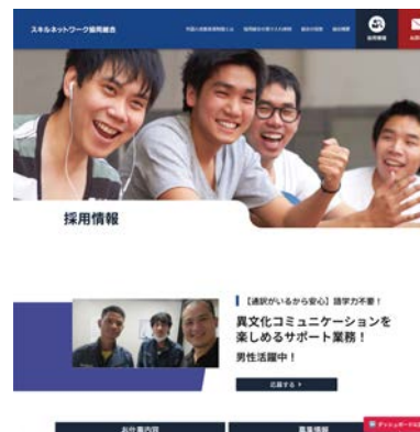
【募集中の時の画面】